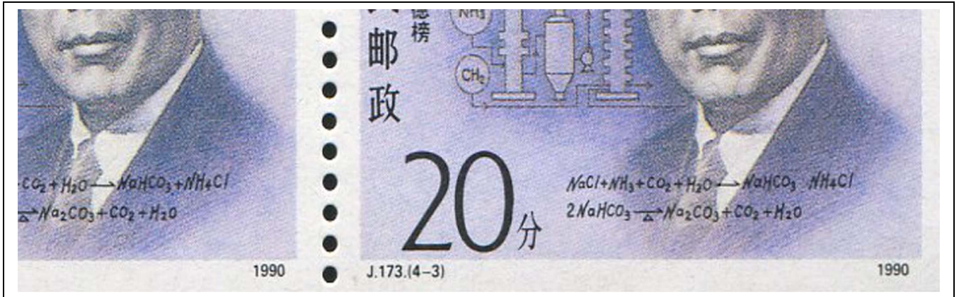
Abb. 2: Normal Marke und Marke mit fehlendem Plus (rechts)

Es gibt eine Marke im Bogen wie der Viererblock zeigt (Marke 4/4). Der Bogen besteht aus 5x10 Marken. Es ist also die Marke 42 / 50.